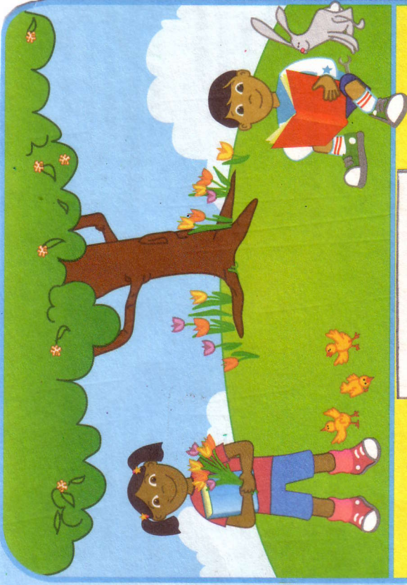
နွေဦးရာသီ