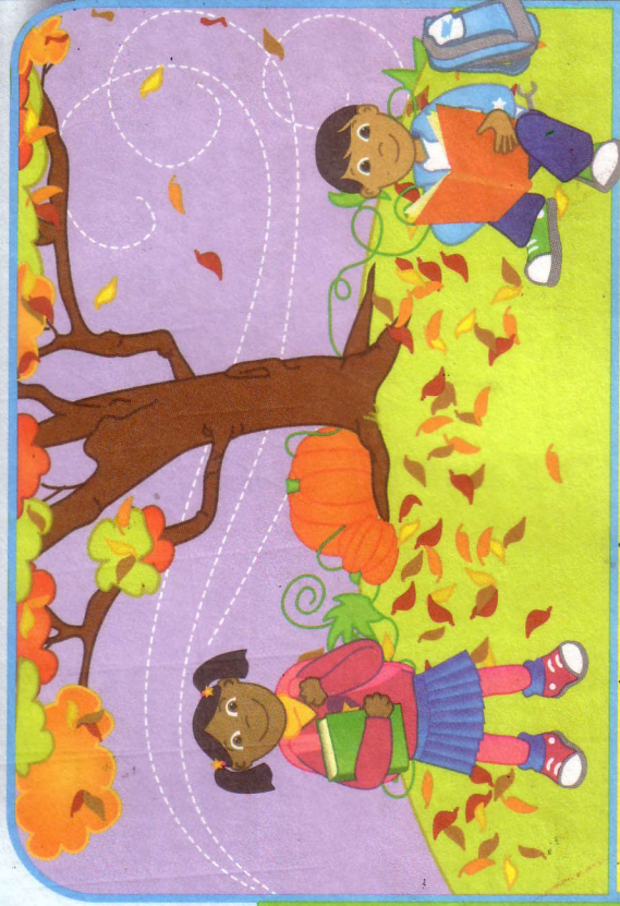
ဆောင်းဦးရာသီ