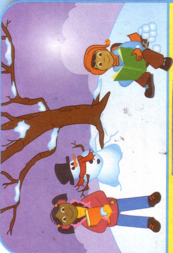
ဆောင်းရာသီ